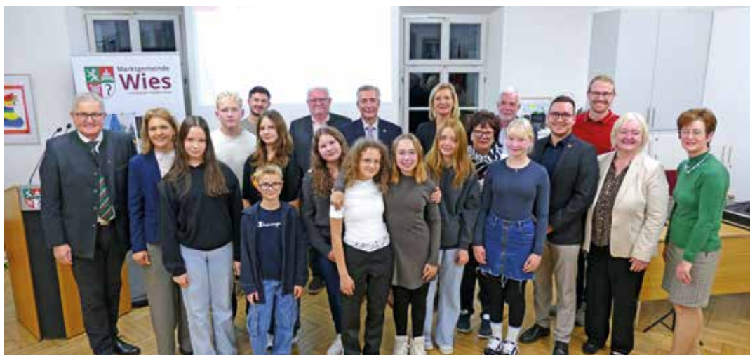
Herzliche Verabschiedung und Danke an die scheidende Kinderbürgermeisterin und ihre Vizebürgermeister sowie Kindergemeinderäte

Der neue Kindergemeinderat blickt nun voller Motivation in die kommenden zwei Jahre – mit vielen Ideen, spannenden Projekten und dem Ziel, die Stimme der Kinder in Wies weiterhin stark hörbar zu machen.