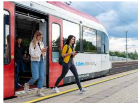
Die Koralmbahn bietet eine Vielzahl an Tickets für unterschiedliche Bedürfnisse. Pendler in der Steiermark können das KlimaTicket Steiermark nutzen, während Pendler nach Kärnten das KlimaTicket Österreich erwerben können. Für Gelegenheitsfahrer in ganz Österreich gibt es das Sparschiene-Ticket , und für den Freizeitverkehr steht das Freizeit Ticket Steiermark zur Verfügung.

Die Fahrzeiten vom Bahnhof Weststeiermark innerhalb Österreichs reduzieren sich zum Teil massiv: