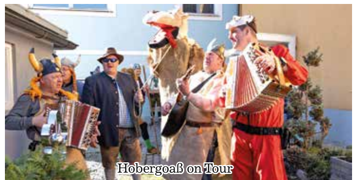
Hobergoaß on Tour