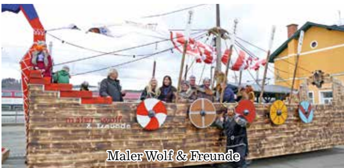
Maler Wolf & Freunde