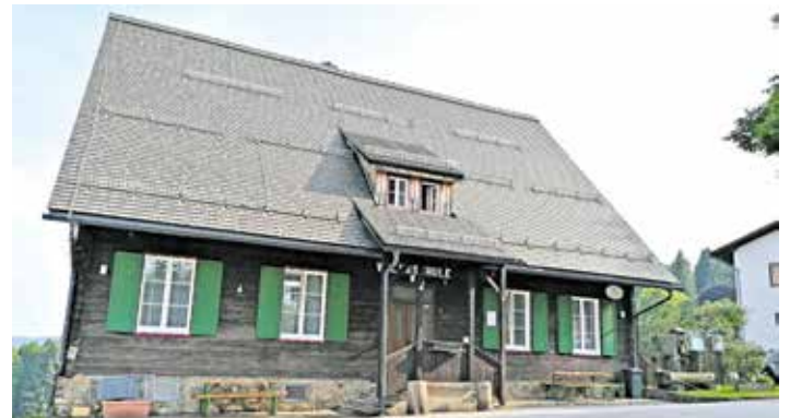
St. Katharina Stüberl

Von Montag bis Donnerstag steht das St. Katharina Stüberl weiterhin für Seminare oder Vereinsveranstaltungen auf Voranmeldung zur Verfügung.