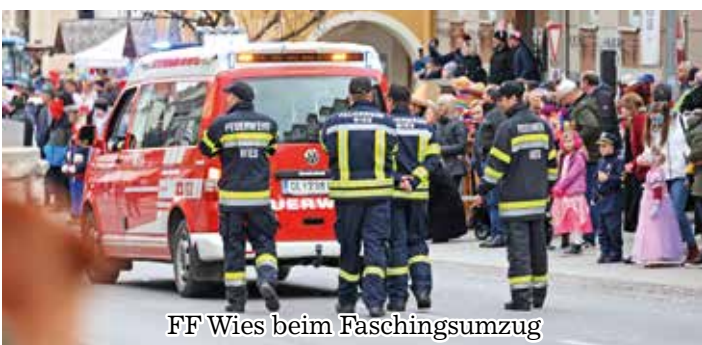
FF Wies beim Faschingsumzug