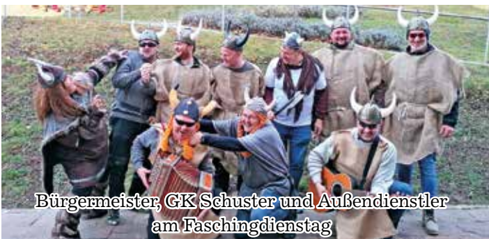
Bürgermeister, GK Schuster und Außendienstler am Faschingdienstag