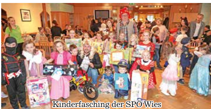
Kinderfasching der SPÖ Wies