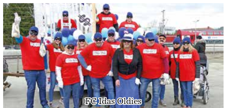
FC Idas Oldies