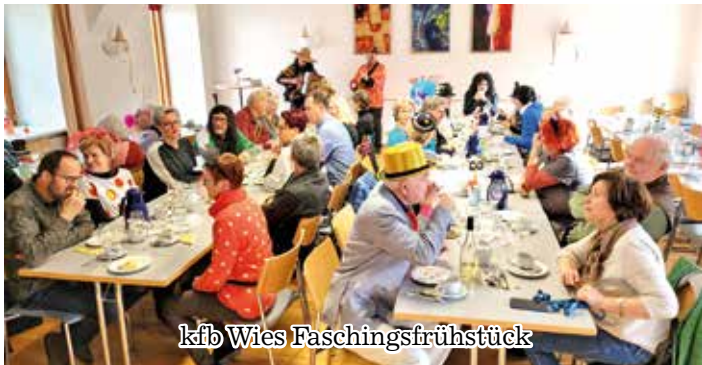
kfb Wies Faschingsfrühstück