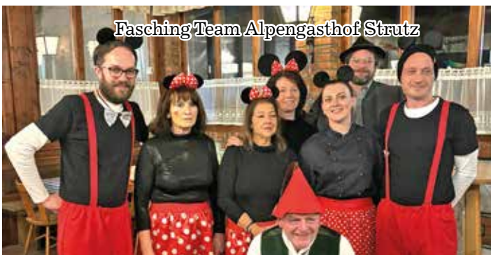
Fasching Team Alpengasthof Strutz