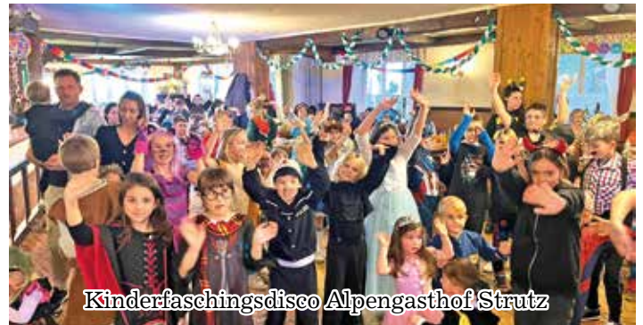
Kinderfaschingsdisco Alpengasthof Strutz