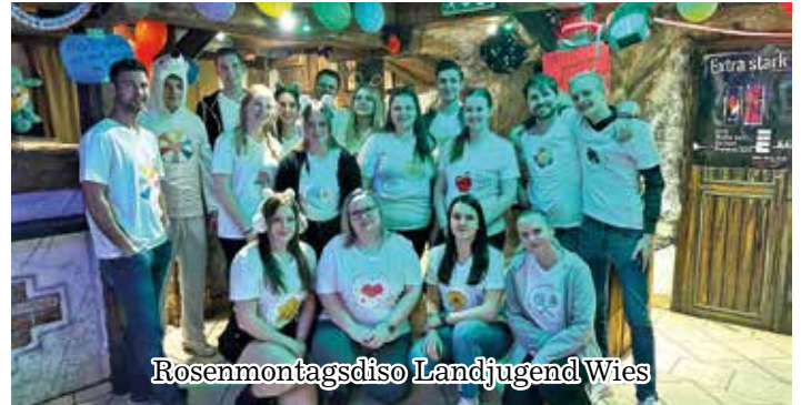
Rosenmontagsdisco Landjugend Wies