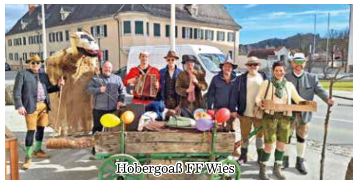
Hobergoaß FF Wies