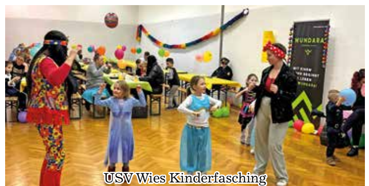
USV Wies Kinderfasching