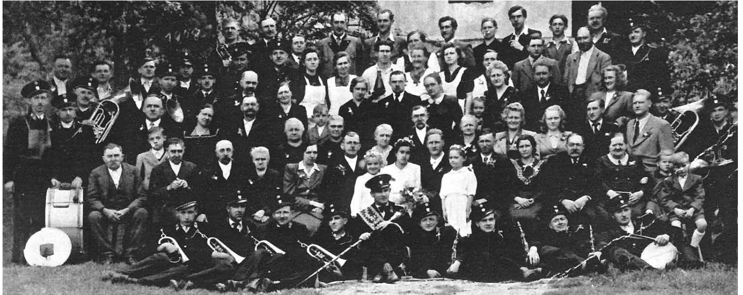
07. 06. 1948: Hochzeitgesellschaft